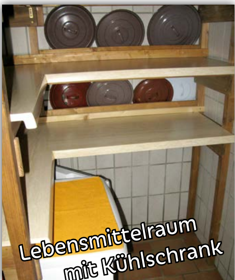
Lebensmittelraum mit Kühlschrank