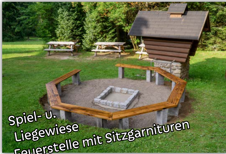
Spiel- u. Liegewiese Feuerstelle mit Sitzgarnituren