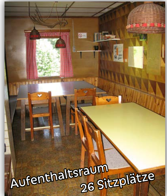
Aufenthaltsraum 26 Sitzplätze