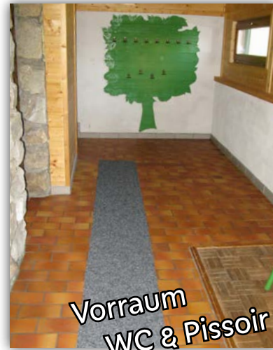
Vorraum WC & Pissoir