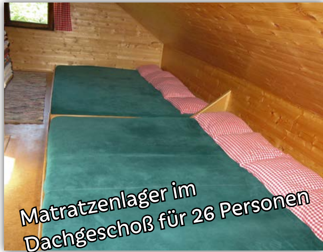
Matratzenlager im Dachgeschoß für 26 Personen