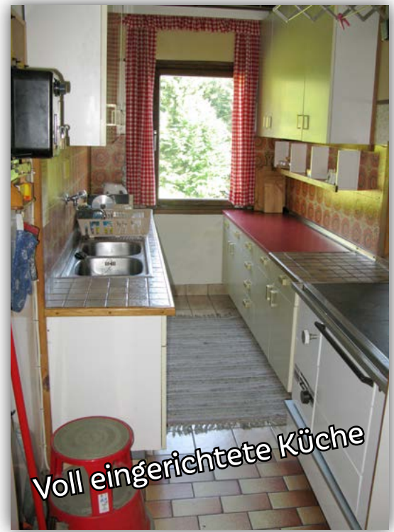
Voll eingerichtete Küche