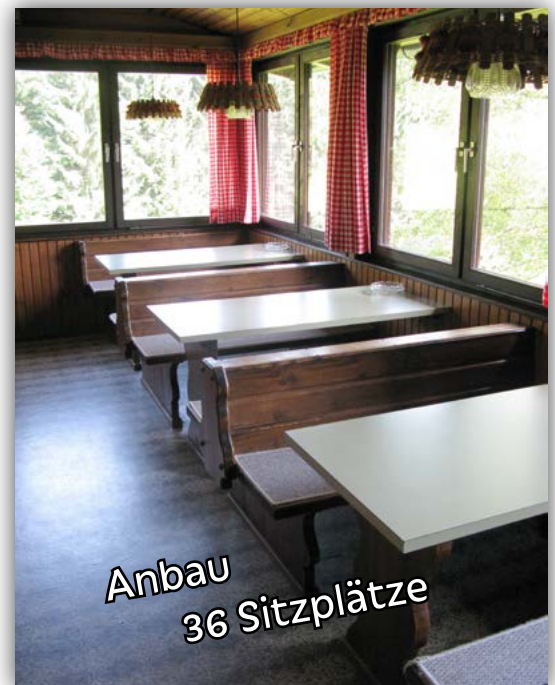
Anbau 36 Sitzplätze