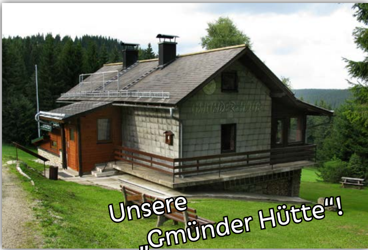
Unsere „Gmünder Hütte“!