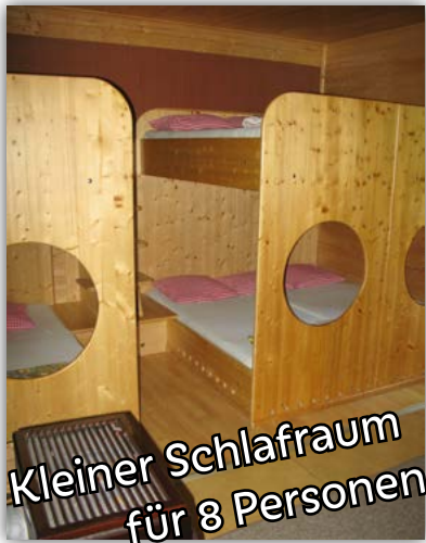
Kleiner Schlafraum für 8 Personen